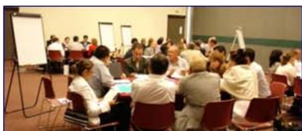
Mesas de trabajo en las que se revisaron casos de los participantes.