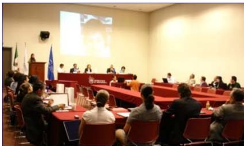
Presentación del caso "¿Nos atrevemos?..." durante el cual se hizo una conexión mediante Internet, con la autora en España.

El Comité leyó con anticipación los casos e hizo comentarios que ayudarían a las autoras a mejorarlos. Los casos participantes correspondían a diferentes materias: Finanzas, Contabilidad y Relaciones Internacionales. ■