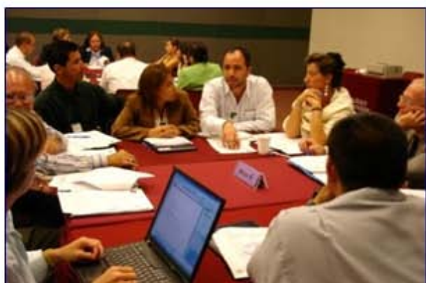
Profesores haciendo comentarios sobre un caso.