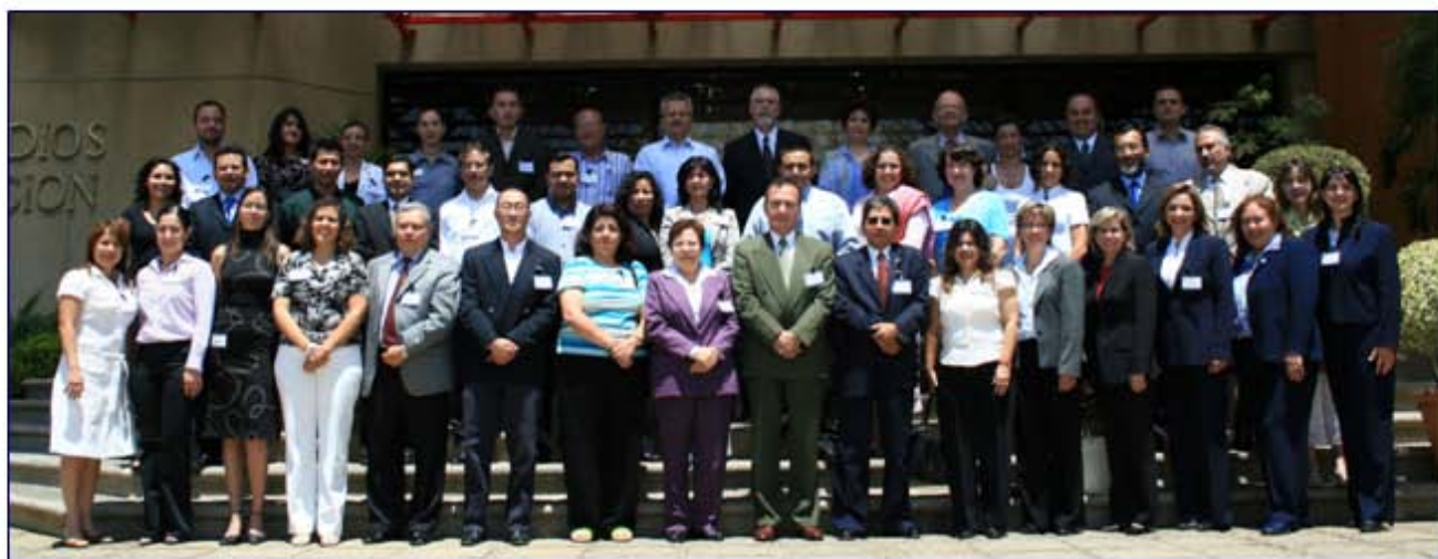
Participantes ALAC 1era Reunión Anual Junio 2006