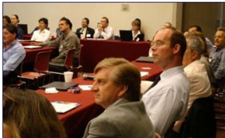
Participantes de ALAC 2006.