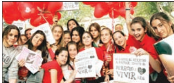
La cinta habla sobre el derecho de las mujeres a decidir.

Este documental revive a través de relatos en primera persona la historia de la lucha por los derechos reproductivos de las mujeres en los Estados Unidos y la presión de los luchadores sociales que lograron cambiar el peligro de los abortos clandestinos hacia una opción legal y más segura. Asimismo el documental incluye información sobre las amenazas que existen en la