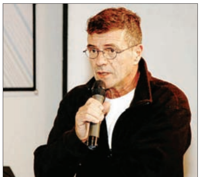
Guillermo Saccomanno obtuvo por unanimidad el Premio Biblioteca Breve 2010 por su obra la novela “El Oficinista”.