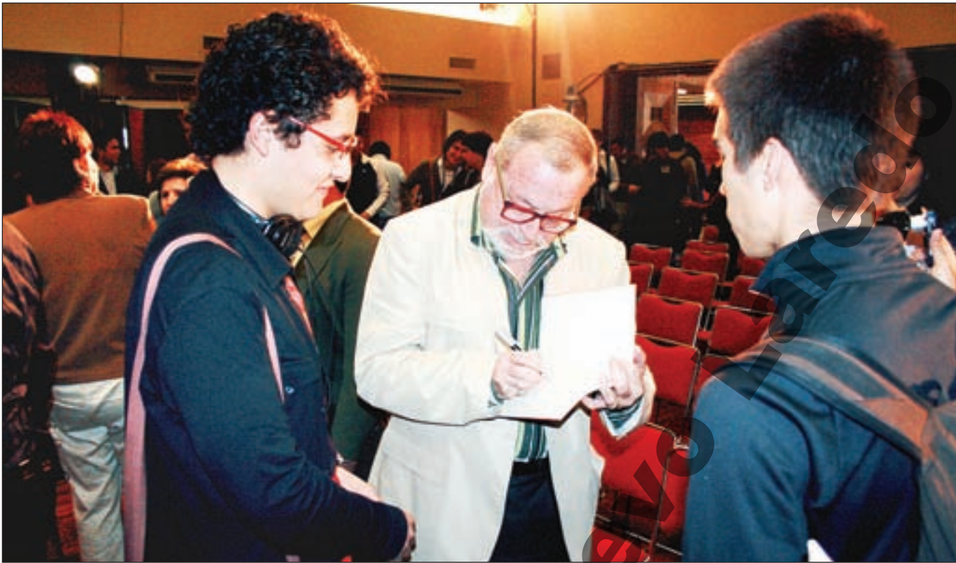
El escritor Fernando Savater compartió y convivió con los alumnos de diferentes carreras del Tec de Monterrey.

“Hice teatro y me gustaba no sólo adaptar y montar obras sino también interpretarlas; me hubiera encantado ser actor, lo que pasa es que como era gordito y con un ojo estrábico, pues siempre me ponían a hacer el que moría en la cuarta escena”, comentó, lo que causó