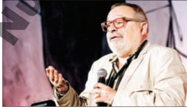
El filósofo declaró en el evento que le hubiera gustado ser actor.