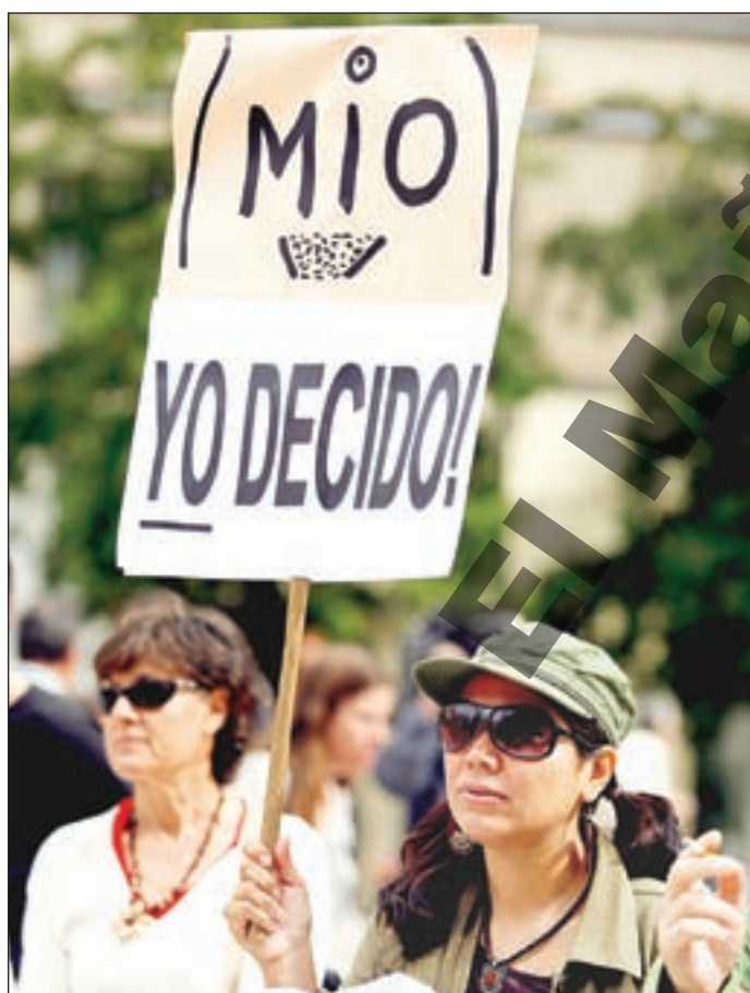
El Colef de Tijuana proyectará el documental, ganador de premios Oscar y Emmy.